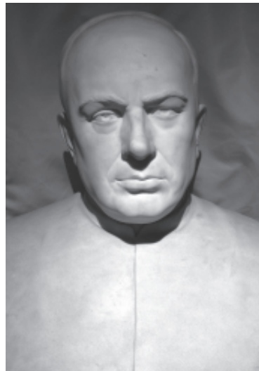
Bust del Pare Ignasi Casanovas