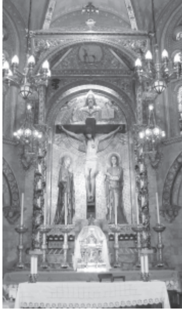
Retaule major. Capella