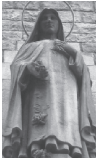
Santa Tereseta del Nen Jesús