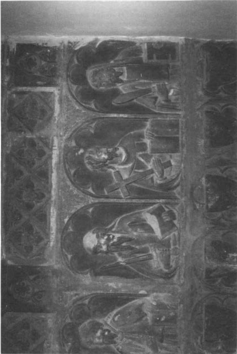
Fig. 7. Predel·la del retaule de Santa Maria d'Albesa. D'esquerra a dreta figures de: Sant Marc, Sant Pau, Sant Felip i Sant Bartomeu.