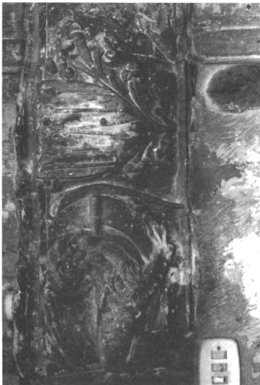
Fig. 8. Mènscula de la capella de Sant Joan de l'església de Sunyer. Escut amb instruments quirúrgics.