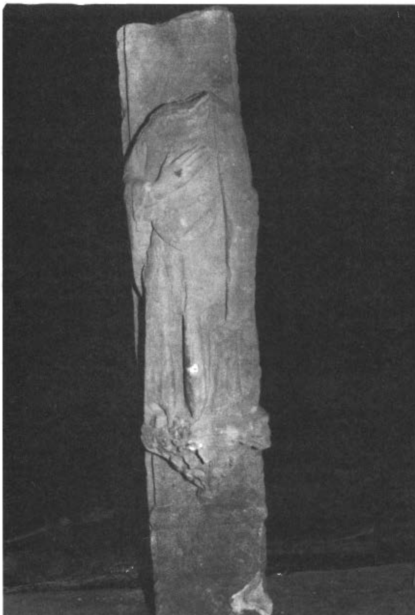
Fig. 4. Figura de profeta del retaule de Sunyer: muntant.