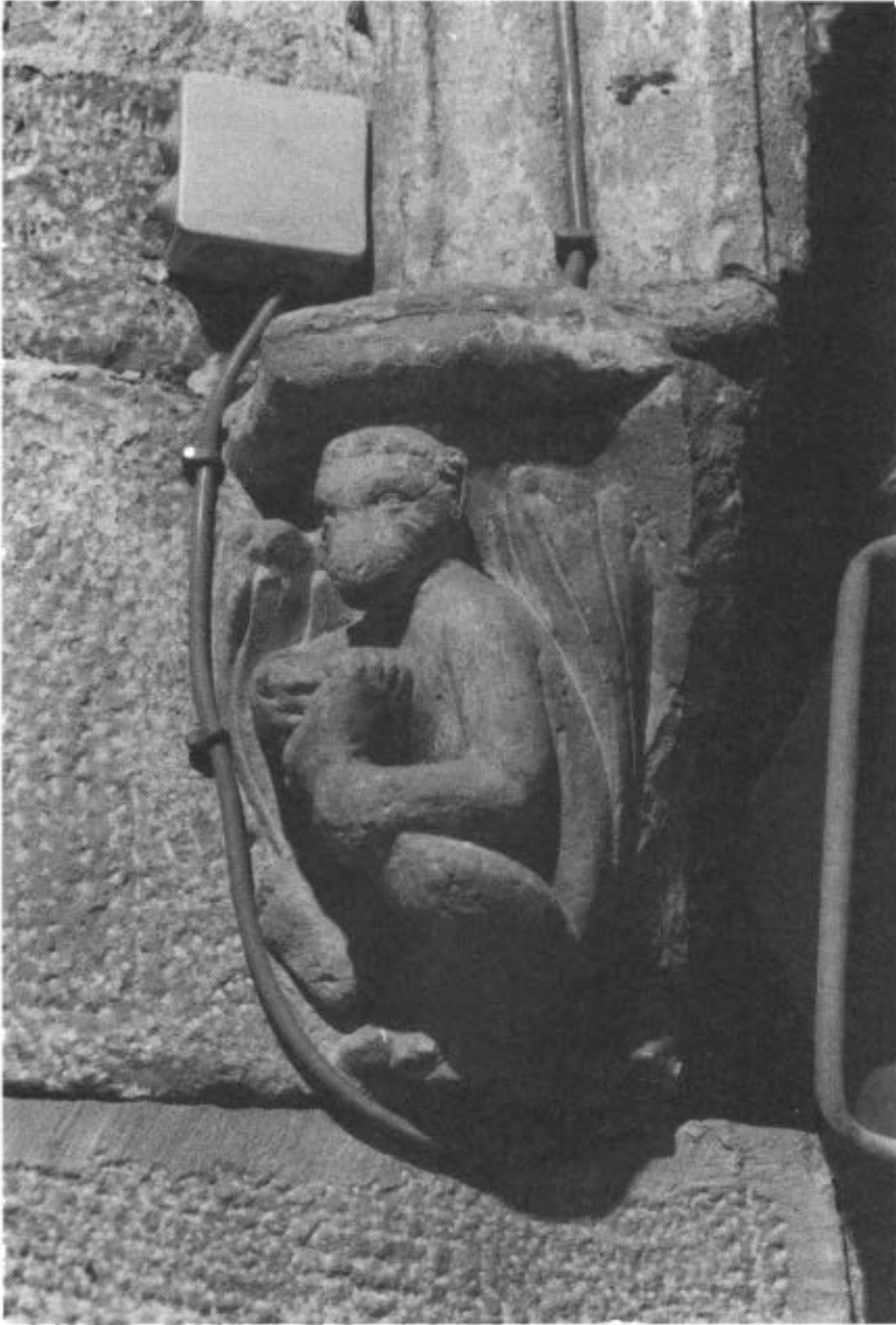
Fig. 10. Capella de Sant Joan de l'església de Torrebesses: Simi-Espinari.