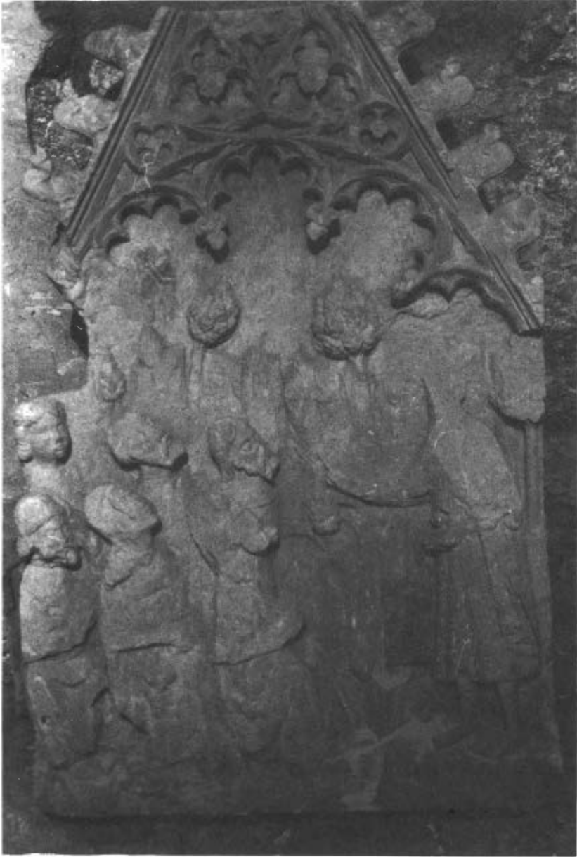
Fig. 1. Relleu del sermó de Sant Joan del retaule de Sunyer.