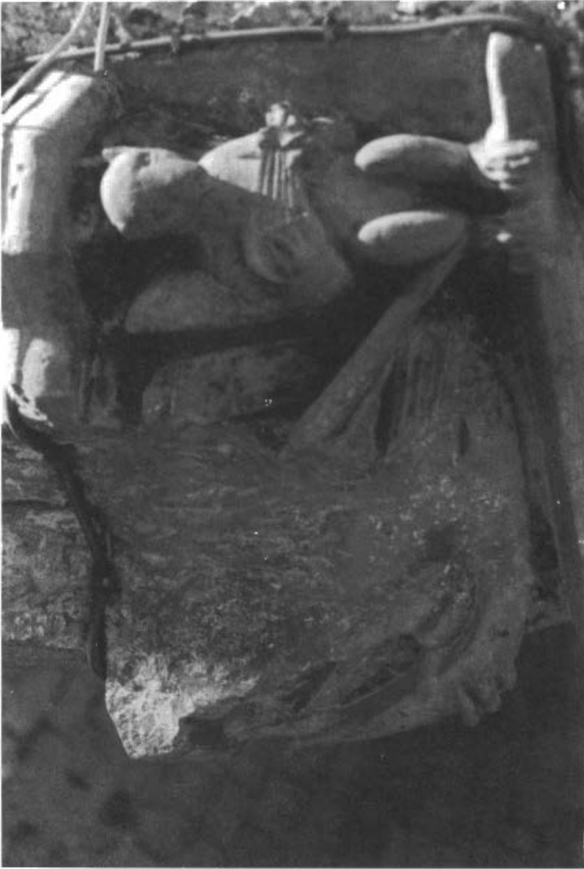
Fig. 9. Mènula de la capella de Sant Joan de l'església de Torrebesses.