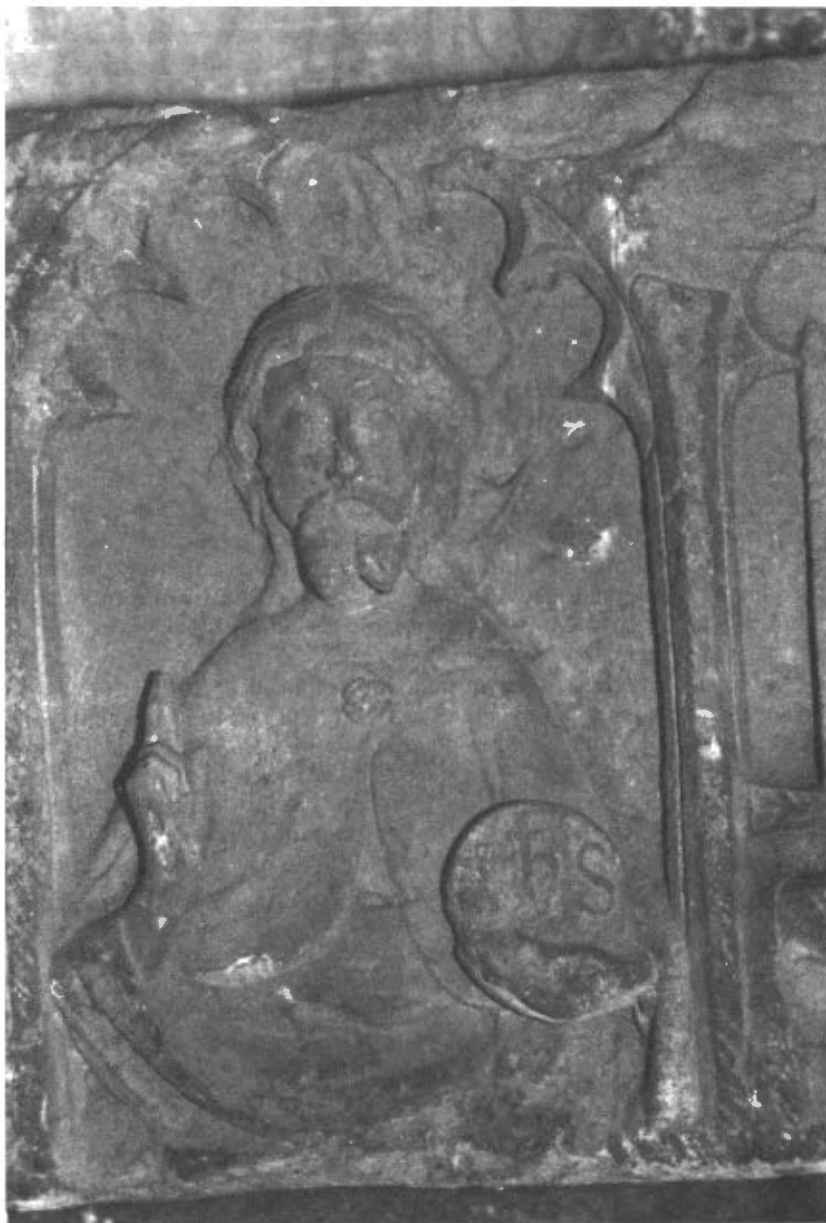
Fig. 6. Figura central de la predel·la del retaule de Sunyer.