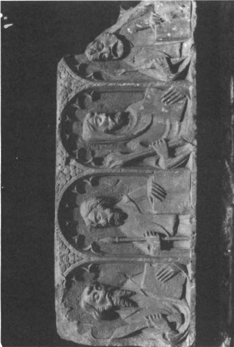
Fig. 5. Precl·la del retaule de Sunyer. D'esquerra a dreta figures de Sant Bartomeu, Sant Tomàs, Sant Bernabé i Sant Simó.