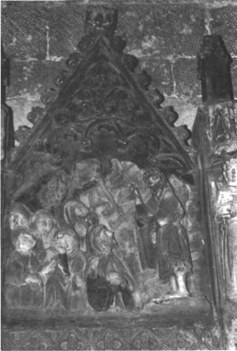
Fig. 2. Relliu del Sermó de Sant Joan del retaule de Torrebesses.