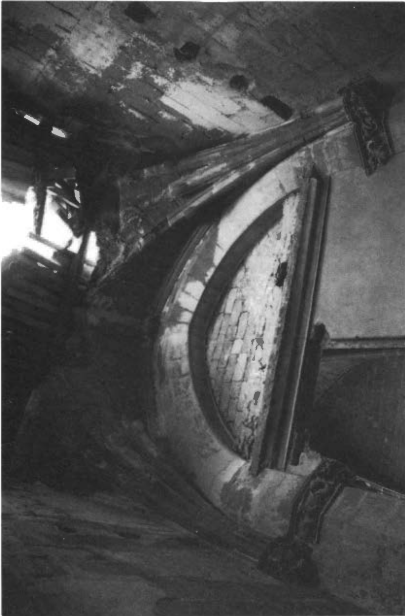
Fig. 6. Interior capella banda esquerra del presbiteri. Església Santa Maria de Castelló de Farfanya.