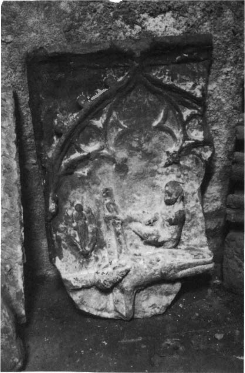
Fig. 7. Fragment Retaule Sant Andreu. Sacristia església Sant Miquel de Castelló de Farfanya.