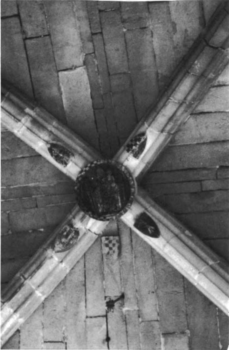
Fig. 3. Clau de volta «Maistas Mariae» . Església Santa Maria de Castelló de Farfanya.