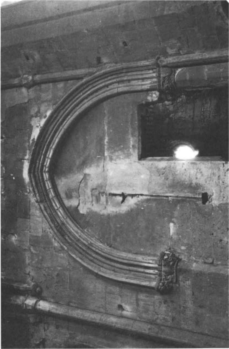
Fig. 4. Capella banda esquerra del presbiteri. Església Santa Maria de castelló de Farfanya.