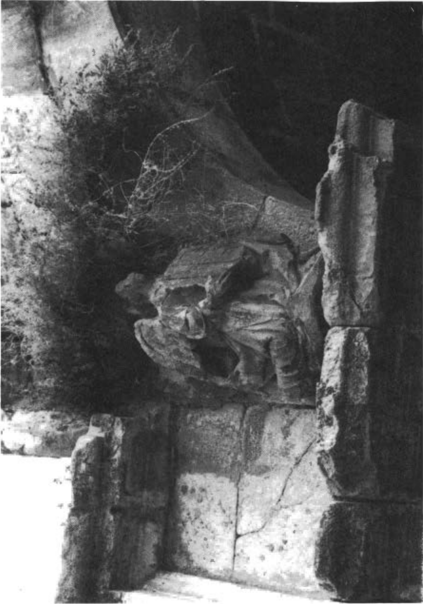
Fig. 8. Angel tenant. Pont monumental Castelló Farfanya.