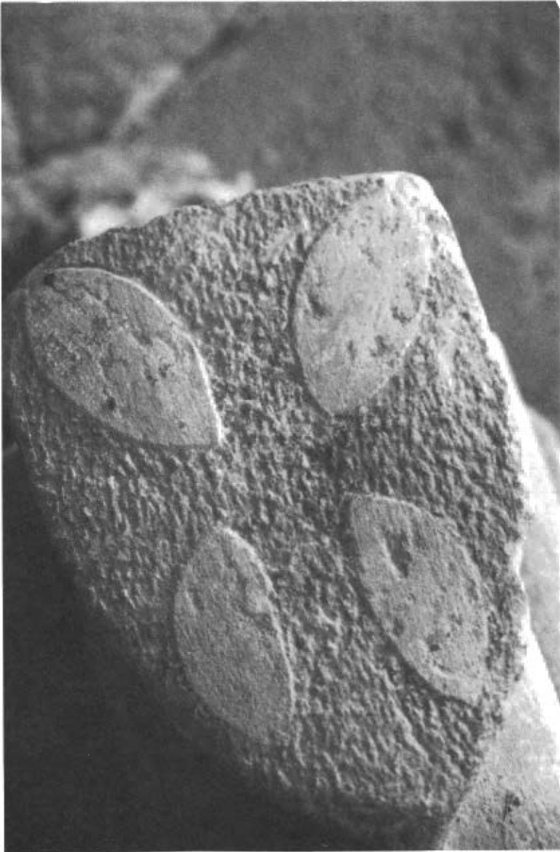
Fig. 2. Heràldica de Cecília de Comenge. Correspon a la clau de volta enderrocada del tercer tram de la nau. Església Santa Maria de Castelló de Farfanya.