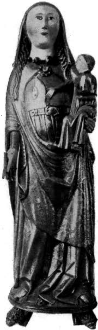
IMAGEN DE LA VIRGEN, DE LA REINA ISABEL