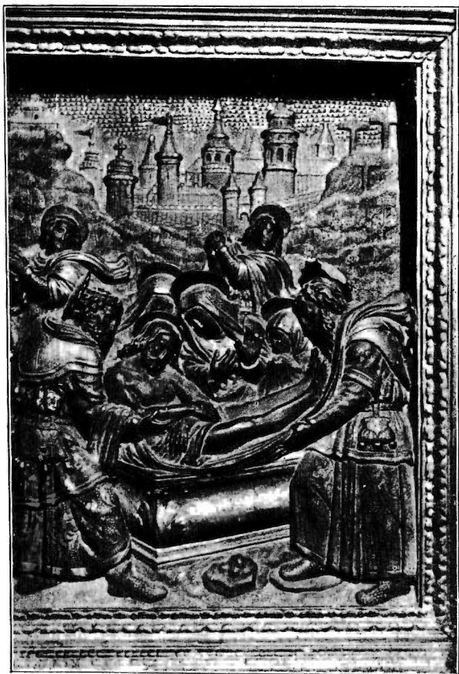
IV.—Retauló o compartiment lateral del retaule major, representant el davallament al sepulcre.