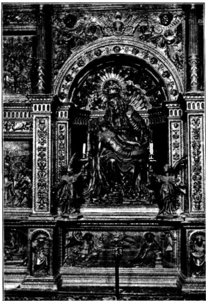
III.—Grup de la Pietat en el ninxol central del retaule major.