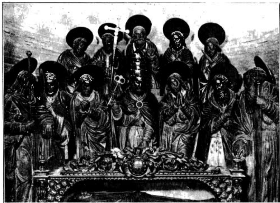
I. - Retaule del sepulcre de Nostra Dona o dels Apòstols Obra de l'escultor Jeroni Xanxo. Any 1549.